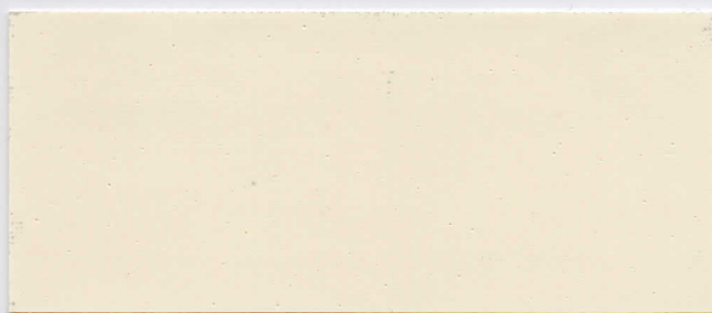
ベージュ (103cm/203cm) 透光率 5.6% 補修テープ

※上記データは測定値であり、保証値ではありません。※防汚加工を施しています。 ※但しKグリーンは103cm巾のみです。